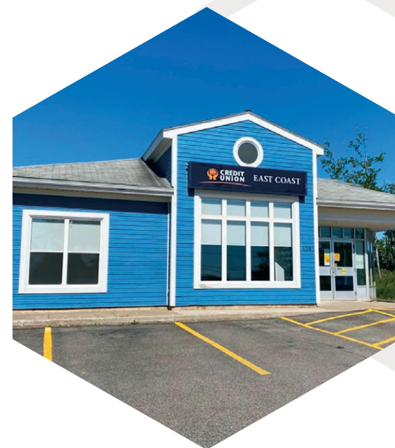
Caisse d'épargne et de crédit East Coast 138 Main Street Port Hood (Nouvelle-Écosse)