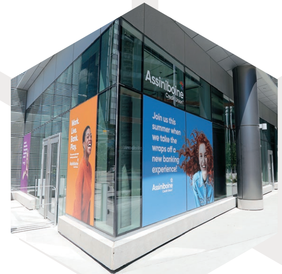
Caisse Assiniboine 100-223 Carlton Avenue Winnipeg (Manitoba)